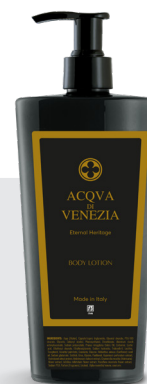
ADV012 Body lotion